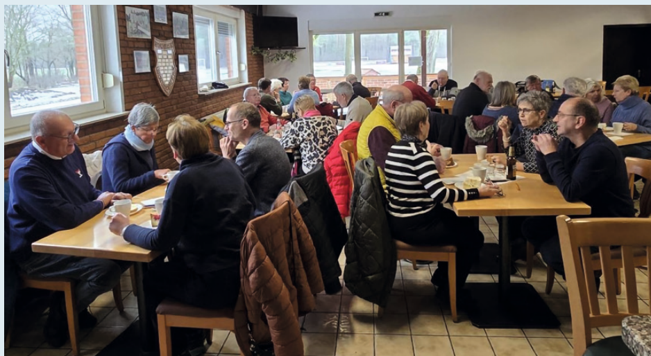
Professionelles Umrüsten auf LED Technologie auf dem Sportplatz an der Hoper Straße.