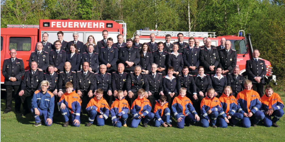
Jubiläumfoto der Feuerwehr Lindwedel zum 100jährigen Bestehen.