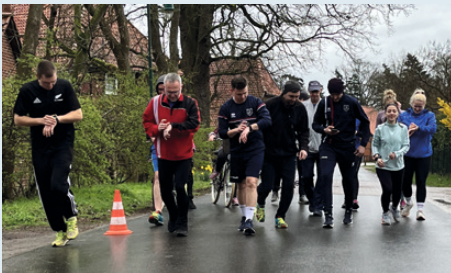
Wie lange gibt es die Feuerwehr Lindwedel jetzt schon? 100 Jahre? Wie viele Stunden sind das? Prüfend macht diese Startergruppe des Spendenlaufes „Hilfe für Helfer“ auf die Uhr.