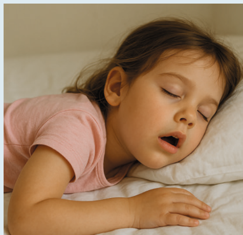
Das Atmen durch den Mund ist ungesünder als durch die Nase.