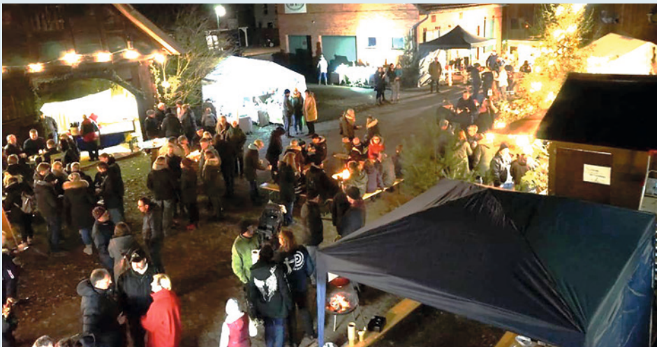
Gemütliches Schlendern ist auf dem Weihnachtsmarkt in Hope wieder möglich.

Am 29.11.2025 ist es endlich wieder soweit und die Dorfgemeinschaft Hope lädt zum Weihnachtsmarkt ein. Eröffnet wird der Markt um 15 Uhr durch die Löschzwerge , welchen den Weihnachtsbaum inmitten des Hoper Hofes festlich schmücken. Im Anschluss ist Zeit, um sich in gemütlicher Atmosphäre kulinarisch verwöhnen zu lassen, vielleicht schon das ein oder andere Geschenk an den Kunsthandwerksständen zu finden oder am Feuerkorb nette Gespräche zu führen und sich die Wartezeit auf den Weihnachtsmann zu verkürzen, welcher gegen 17 Uhr seine Ankunft angekündigt hat. Auf die Kleinsten Marktbesucher wartet eine Schminkecke .