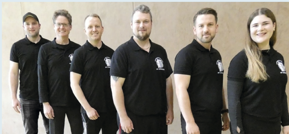
Die 1. Bundeliga Luftpistolenmannschaft des Schützenvereins Lindwedel.

Nach dieser Veranstaltung ist es dem Schützenverein Lindwedel eine besondere Herzensangelegenheit sich bei den Fans zu bedanken . Wieder mal sind die Schützen und alle anderen Mitwirkenden überwältigt von der tollen Stimmung und der Unterstützung . Ein weiteres riesiges Dankeschön gilt den Sponsoren , welche mit großen und kleinen Spenden diese Veranstaltung und den Erfolg für unseren hiesigen Verein überhaupt erst ermöglichen, ebenso wie die vielen fleißigen Helfer im Vorder- und Hintergrund. Spätestens am letzten Januarwochenende steht fest, ob der SV Lindwedel im nächsten Jahr wieder in der höchsten deutschen Liga des Schießsports starten darf.