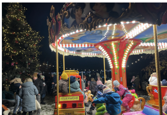
Es gibt in diesem Jahr wieder das beliebte Kinderkarussell auf dem Weihnachtsmarkt in Lindwedel.