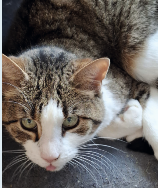
...und Kira suchen gemeinsam ein neues zu Hause.