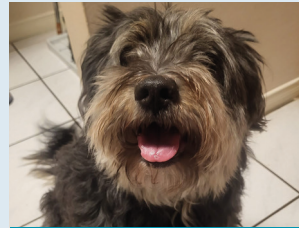
Wuschel sucht ein neues Zuhause

Der kleine Wuschel hat vor einigen Monaten sein Herrchen verloren und hat jetzt nur noch sein Frauchen. Er ist ungefähr 12 Jahre alt, etwas übergewichtig aber fit für längere Spaziergänge , die ihm aktuell fehlen, da sein Frauchen diese nicht allein bewältigen kann. Die häusliche Situation hat sich für Wuschel völlig verändert, und seiner Meinung nach ist er jetzt der Herr im Haus. Als an sich freundlicher, aufgeschlossener und verschmuster Rüde fehlt ihm der Mensch, der dem selbstbewussten kleinen Hund seine Grenzen aufzeigt . Wuschel mag Menschen und Hündinnen, aber Rüden eher nicht . Wuschel's Frauchen hat sich schweren Herzens entschlossen, für Wuschel andere und hundereifarene Menschen zu suchen, die bereit sind, etwas Zeit und Geduld in seine Erziehung zu investieren und ihm verständlich machen können, dass nicht er das Sagen hat. Vielleicht sind Sie der richtige Mensch für den Kleinen? Ein unverbindliches Kennenlernen kann gern verabredet werden. Mögen Sie Tiere und haben Sie Interesse an einer ehrenamtlichen Tätigkeit? Unser Verein kann noch vielfache (ehrenamtliche) Unterstützung gebrauchen! Kommen Sie gern ganz unverbindlich zu unseren monatlichen Treffen, die Termine finden Sie auf unserer Homepage www.haustierhilfeheidekreis.de oder telefonisch bei: Brigitte Morgenroth, Tel.: 05194 / 974660 oder Rüdiger Nickel, Tel.: 05194 / 494 .